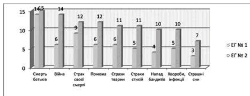
Рис. 1. Показники змісту страхів в ЕГ № 1 і ЕГ № 2 за методикою «Страхи в будиночках» (М.О. Панфілової)