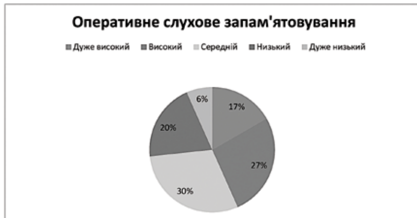
Рис. 1. Діаграма результатів дослідження оперативного слухового запам'ятовування

Перспективи подальшого вивчення окресленої проблематики ми вбачаємо в емпіричних дослідженнях значно більшої чисельності вибірки і розширенні кола вивчення пізнавальних процесів дітей із вадами психофізичного розвитку на різних вікових етапах.