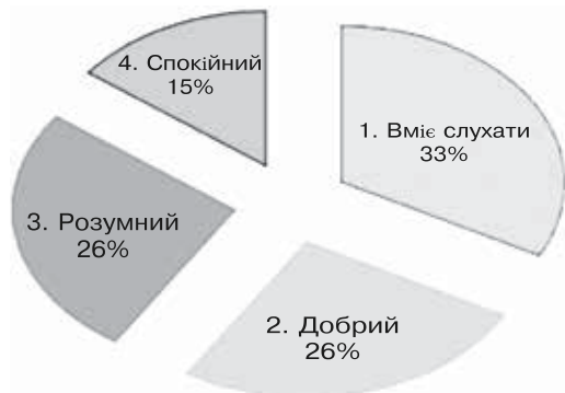
Рис. 1. Особистісні якості психолога за даними контент-аналізу методики «Методика визначення професійних стереотипів» у групі студентів 1-го курсу

Контент-аналіз якостей особистості, виявлених за допомогою методики – «Методика визначення професійних стереотипів».