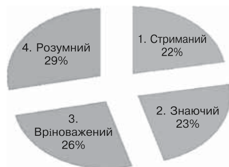
Рис. 4. Особистісні якості психолога за даними контент-аналізу методики «Методика визначення професійних стереотипів» у групі студентів 5-го курсу

За результатами контент аналізу при оцінці «Образу психолога» у студентів 1 курсу при перерахуванні особистісних якостей переважають такі, як: вміє слухати (33%), розумний (26%), добрий (26%), спокійний (15%); серед професійних якостей переважають: толерантність (35%), досвідченість (28%), компетентність (22%), зацікавленість професією (15%), міжособистісні: розуміючий, емпатійний (32%), гуманність (28%), комунікабельність (25%), альтруїзм (15%).