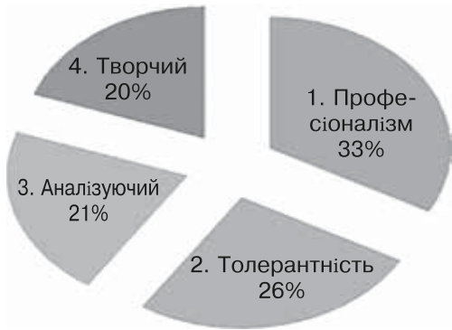
Рис. 8. Професійні якості психолога за даними контент-аналізу методики «Методика визначення професійних стереотипів» у групі практикуючих психологів