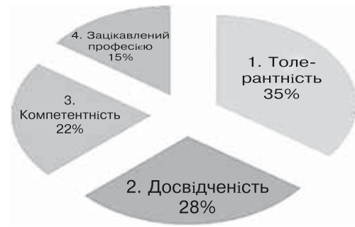
Рис. 2. Професійні якості психолога за даними контент-аналізу методики «Методика визначення професійних стереотипів» у групі студентів 1-го курсу