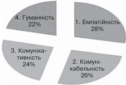
Рис. 9. Міжособистісні якості психолога за даними контент-аналізу методики «Методика визначення професійних стереотипів» у групі практикуючих психологів

У студентів 5 курсу при перерахуванні особистісних якостей переважають такі, як: розумний (29%), врівноважений (26%), знаючий (23%), стриманий (22%); серед професійних якостей переважають: професіоналізм (31%), компетентність (30%), етичність (22%), досвід (17%), а серед міжособистісних: комунікабельність (39%), емпатійність (31%), гуманність (30%).