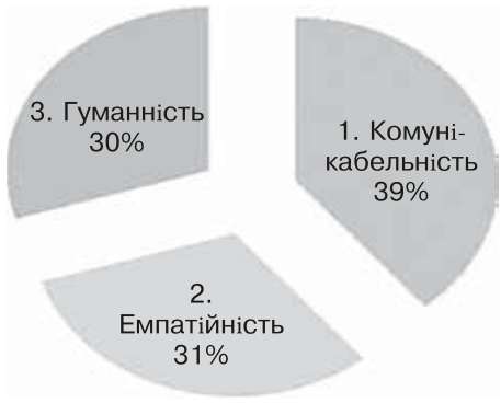
Рис. 6. Міжособистісні якості психолога за даними контент-аналізу методики «Методика визначення професійних стереотипів» у групі студентів 5-го курсу