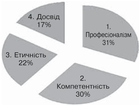
Рис. 5. Професійні якості психолога за даними контент-аналізу методики «Методика визначення професійних стереотипів» у групі студентів 5-го курсу