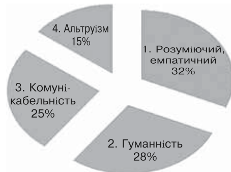
Рис. 3. Міжособистісні якості психолога за даними контент-аналізу методики «Методика визначення професійних стереотипів» у групі студентів 1-го курсу

За результатами контент аналізу при оцінці «Образу психолога» у студентів 1 курсу при перерахуванні особистісних якостей переважають такі, як: вміє слухати (33%), розумний (26%), добрий (26%), спокійний (15%); серед професійних якостей переважають: толерантність (35%), досвідченість (28%), компетентність (22%), зацікавленість професією (15%), міжособистісні: розуміючий, емпатійний (32%), гуманність (28%), комунікабельність (25%), альтруїзм (15%).