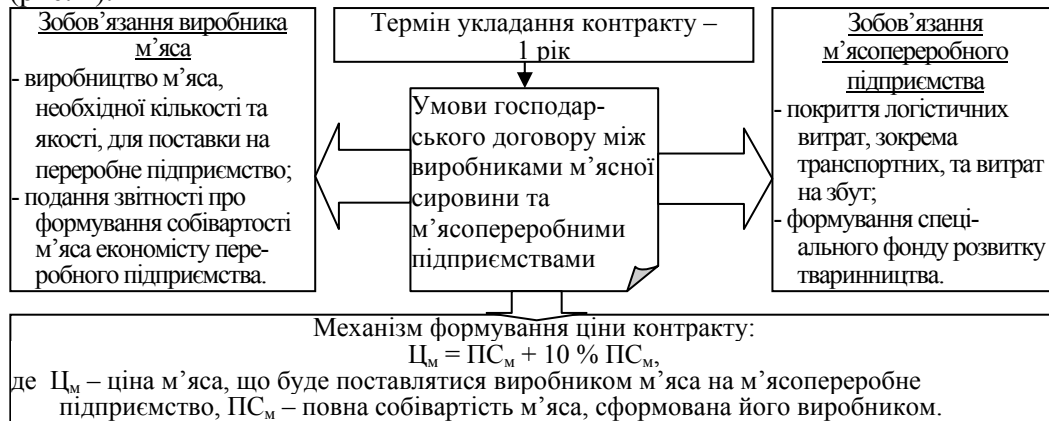
Рис. 2. Напрями вдосконалення договірних відносин між підприємствами м'ясопродуктового підкомплексу*

еквівалентному виручці від реалізації продукції, виробленої із сировини цього господарюючого суб'єкта; при виникненні форс-мажорних обставин (масовий падіж худоби, стихійні лиха тощо) умови контракту підлягають перегляду (рис. 2).