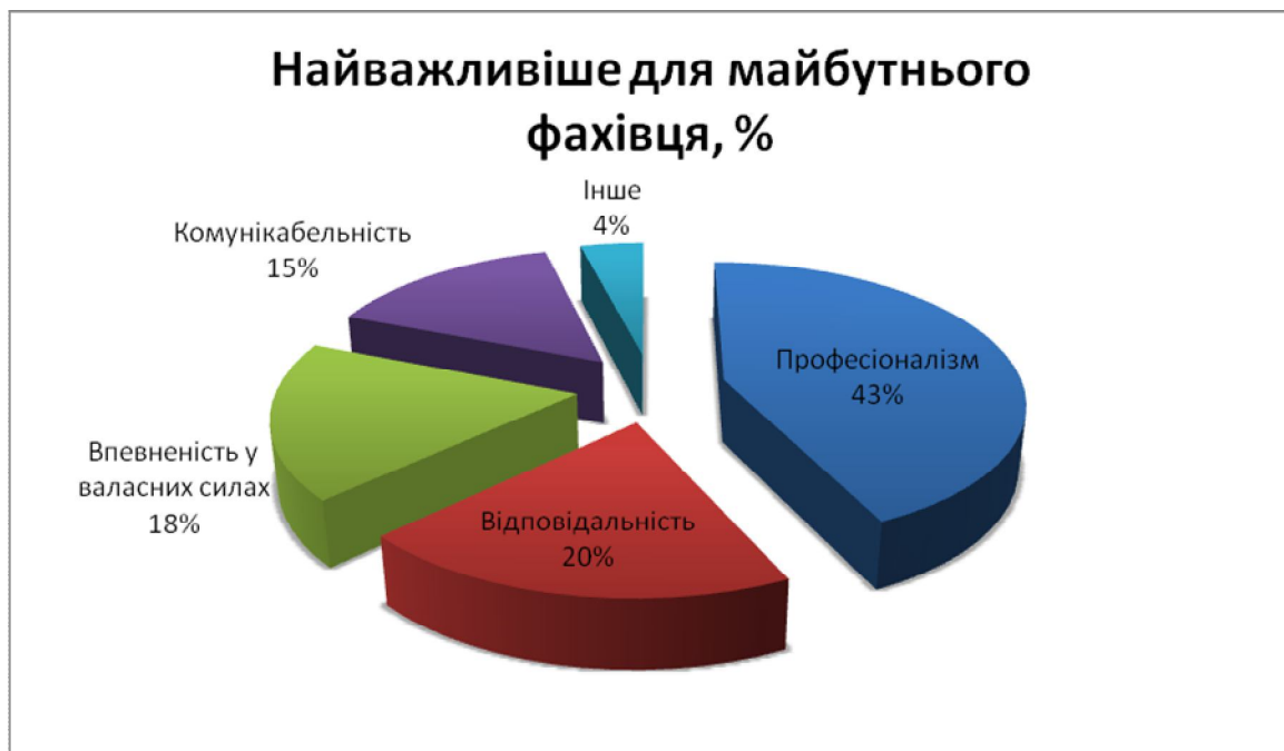
Рис. 2. Найважливіше для майбутнього фахівця.

Матеріали анкетування розглядалися на всіх рівнях організації навчального процесу і працевлаштування.