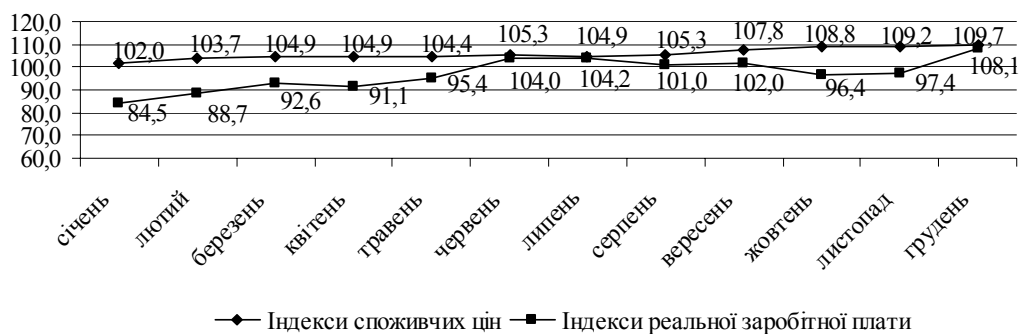
Рис. 2 Індекси споживчих цін та реальної заробітної плати у Львівській області (у % до грудня 2009 року)

Поряд з існуючим диспаритетом цін стримує нарощення обсягів виробництва сільськогосподарських підприємств і недостатній рівень внутрішнього споживчого попиту, що є результатом низької купівельної спроможності населення. Зокрема, як можемо спостерігати з рис. 2, у 2010 році індекси зростання реальної заробітної плати у Львівській області відставали від індексів споживчих цін.