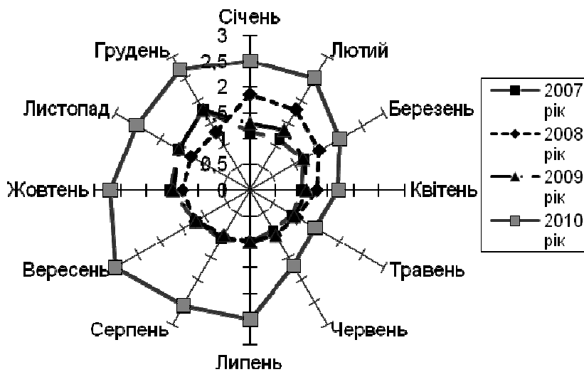
Рис. 2. Динаміка закупівельних цін на молоко у населення с. Рахнівка Дунаєвського району Хмельницької області

У 2010 р. рівень цін дещо підвищився, однак індивідуальні виробники молока зазнають утисків з боку молокозаводів. Молокопереробні підприємства відмовляються укладати договори з селянами як щодо ціни на молоко, так і щодо так званої “соціальної угоди”, згідно з якою вони мають сплачувати півкопійки за кожний літр молока; тендери на право закупівлі молока також не проводяться. Про зміну ціни селян не інформують. Фактично молокозаводи організували монопольну змову, спрямовану проти селян задля власного збагачення. Механізм вільного ціноутворення, який є нормою для всіх розвинутих країн, в Україні відсутній.