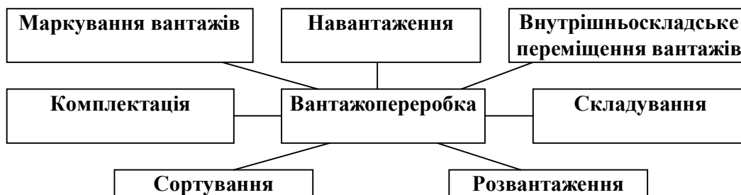
Рис. 3. Складові частини процесу вантажопереробки

Остання ланка – вантажопереробка. Процес вантажопереробки зображений на рис. 3.