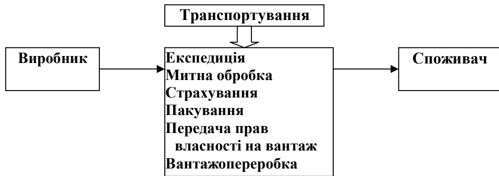
Рис. 2. Процес транспортування на макрорівні

Розглянемо управління транспортною логістикою підприємства у сфері зовнішньоекономічної діяльності на основі концепцій управління окремими ланками процесу транспортування на макрорівні і визначимо вигоду від використання транспортної логістики на підприємстві у сфері ЗЕД. Процес транспортування на макрорівні зображений на рис. 2.