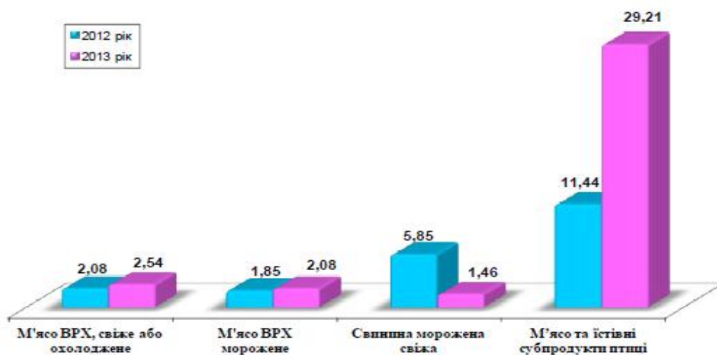
Рис.1. Динаміка експорту м'ясопродуктів у січні – березні 2012 – 2013 років, тис. тонн.

(7%, або 2,54 тис. тонн), яловичину морожену (5,7%, або 2,08 тис. тонн) та свинину (4%, або 1,46 тис. тонн) (рис.1).