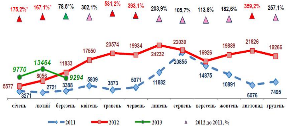
Рис. 3. Обсяги імпорту свинини, тонн

Середня ціна завезеної свинини становила 2,16 дол./кг (17,26 грн.), що на 7,2% вище ніж у січні-березні 2012 року (2,01 дол./кг). Найбільші обсяги поставок свинини в Україну здійснені з Бразилії – 63,5% (20,67 тис. тонн), Німеччини – 17,7% (5,75 тис. тонн) та Польщі – 7,1% (2,31 тис. тонн) від загального обсягу імпорту свинини. У березні 2013 р. постачання свинини було нижчим на 2,5 тис. тонн (21,5%) порівняно з березнем 2012 року.