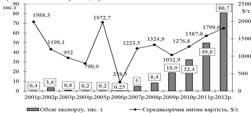
Рис. 1. Експорт м'яса птиці в Україні за 2001-2012 рр.

Це можна пояснити дуже високим рівнем внутрішнього попиту та високими, порівняно з іншими країнами, цінами на м'ясо птиці. Лише з 2006 р. спостерігається стабільне зростання експорту. За 2012 рік він зріс більше, як в 1,6 раза і сягнув 80,7 тис. т. Українське м'ясо птиці експортували головним чином до країн СНД (82% всього експорту), азіатських (14%) та африканських держав (4%). Майже половина експорту в країни СНД припадає на Росію (рис. 2), третина – на Казахстан.