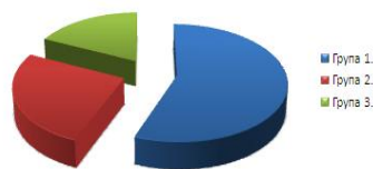
Рис. 2. Найбільш поширені причини неспішності студентів