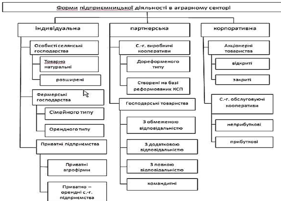
Рис. 2. Класифікація форм підприємницької діяльності в аграрному секторі

Висновки. Підприємництво є досить багатограним поняттям, поширеним в різних галузях економіки. Недоцільно ототожнювати його лише з купівлею-продажем товарів або зі звичайною торговельною чи комерційною діяльністю. Поняття підприємництва набагато ширше. Це не лише особливий вид діяльності, але сукупність відносин, що виникають в ході його здійснення. Тому підприємницьку діяльність можна розглядати за різними ознаками. Відповідно сучасні підходи до класифікації видів підприємництва є неоднозначними. Це обумовлює необхідність подальшого дослідження даного питання для виділення умов ефективного розвитку всіх видів підприємницької діяльності в аграрному секторі.