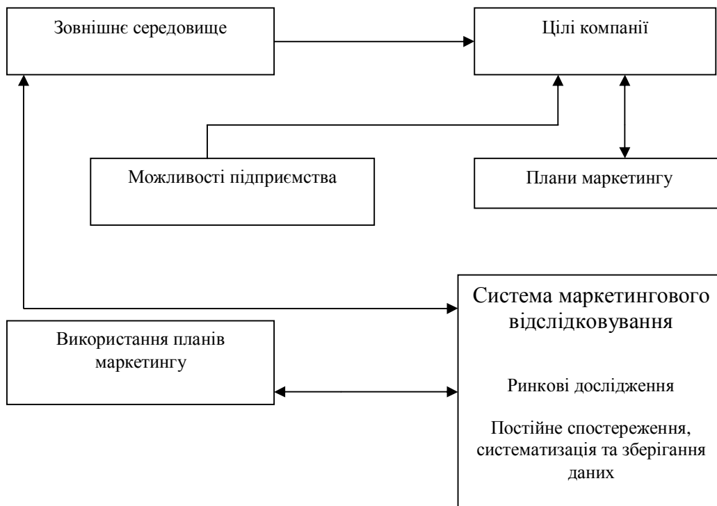
Рис.1. Схема функціонування маркетингової інформаційної системи

- аналіз співвідношення витрат і прибутку, визначення „вузьких” місць.