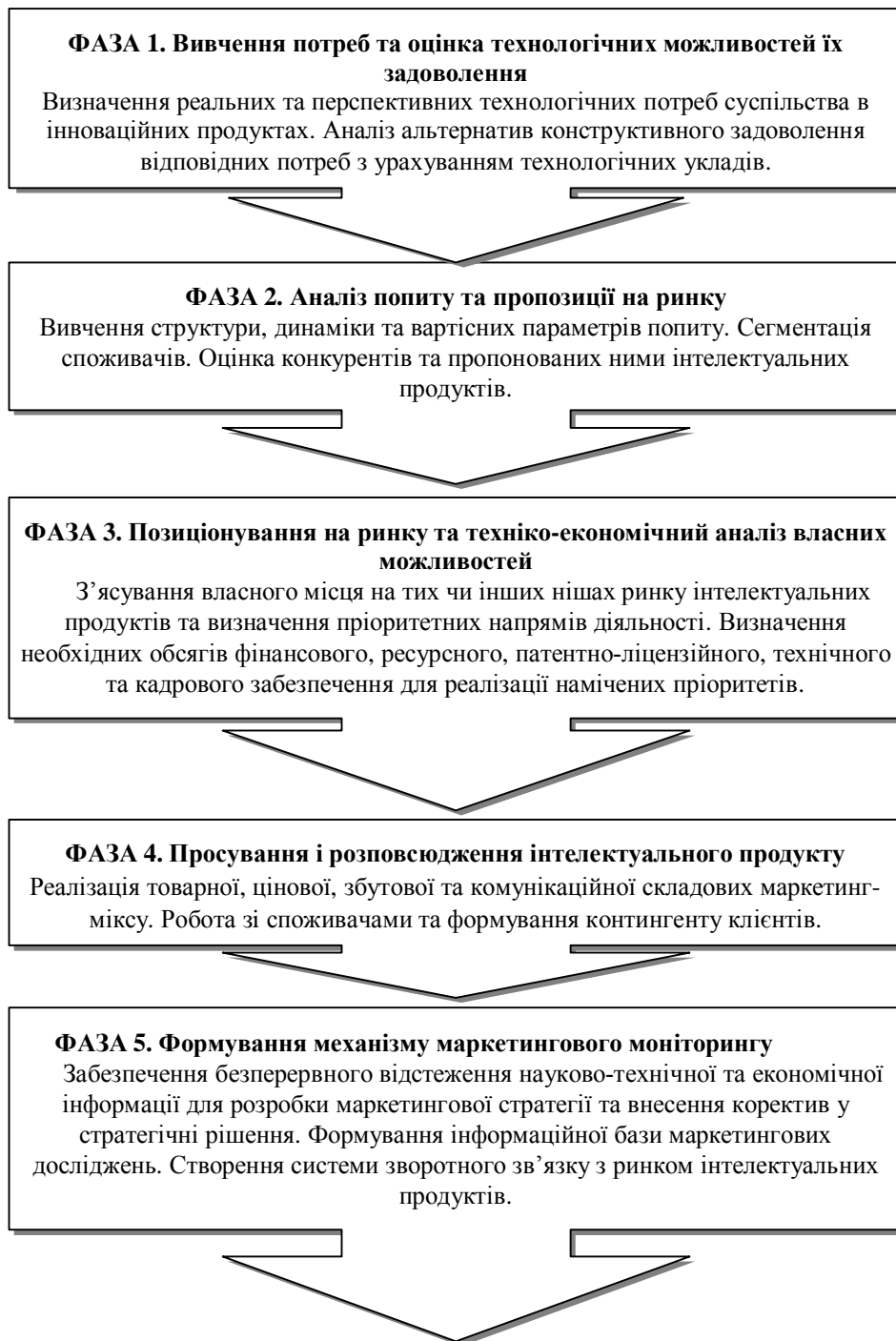
Рис. 3. Програма маркетингу інтелектуальної власності в системі науково-освітнього забезпечення аграрної економіки