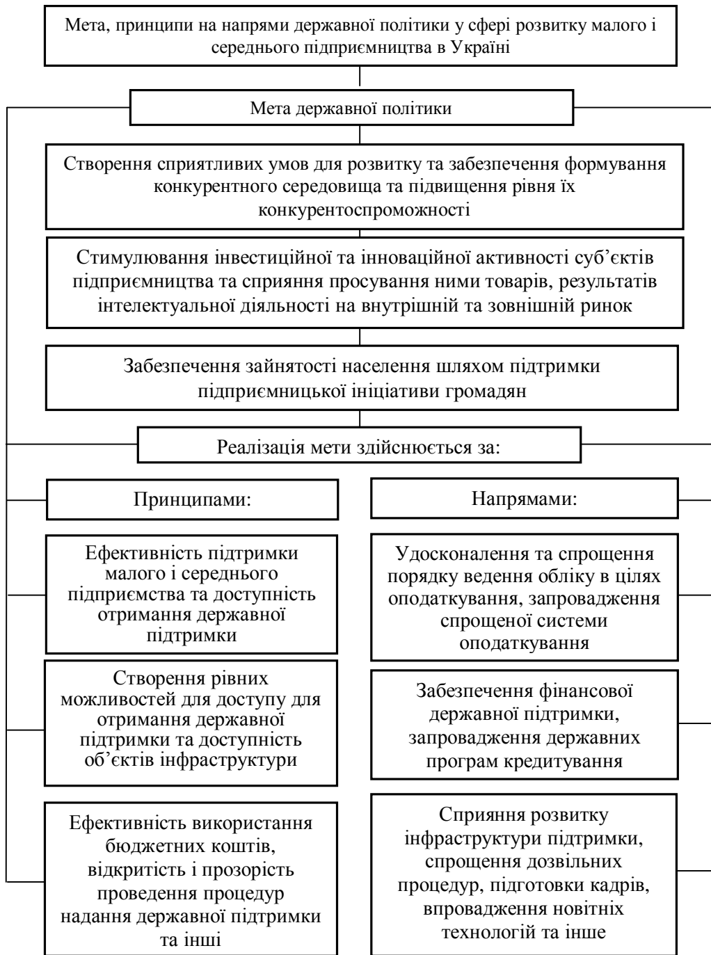
Рис.1. Основні складові здійснення державної політики у сфері розвитку малого і середнього підприємництва в Україні