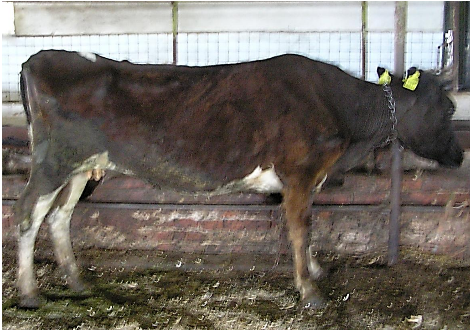
Рис. 3. Лордоз у клінічно хворій на остеодистрофію корови

Апетит у хворих корів збережений, однак у 50,0 % корів за субклінічного перебігу та 88,1 % – клінічно хворих відмічали лизуху – алотріофагію (табл. 2).