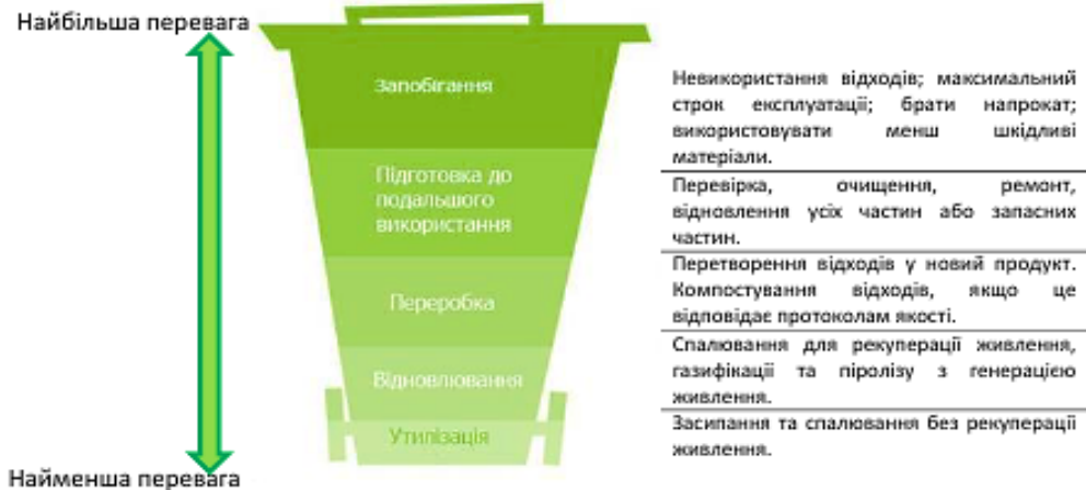
Рис. 2. Ієрархія відходів

переробки побутових відходів, а величина їх переробки знаходиться на низькому рівні. До 2022 року загальний показник переробки побутових відходів має досягти 6% від загального обсягу. Ключовою проблемою є відсутність організованої системи, здатної проводити ефективне збирання вторинної сировини високої якості. Так, у Львівській області є лише 23 пункти прийому вторсировини, а у Жовківському районі – жодного. У Раві-Руській йде до завершення виготовлення документації на землю під сортувальну лінію. Існує потреба запуску такої ж сортувальної лінії і у м. Жовква.