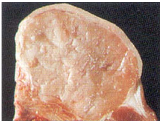
Рис. 1. М'ясо якості PSE

Яловичина з якістю DFD відрізнялася більш темним кольором, порівняно з якісною яловичиною: залежно від віку м'ясо було червоного (бичків віком 18–24 міс.) або темно-червоного кольору (бичків віком 24–36 міс), а корів – з буруватим відтінком. Консистенція м'яса такої якості крихтоподібна, поверхня розрізу суха, від слабжорсткої у м'яса, отриманого від молодших тварин, до високої жорсткості у тварин віком 36–72 міс.