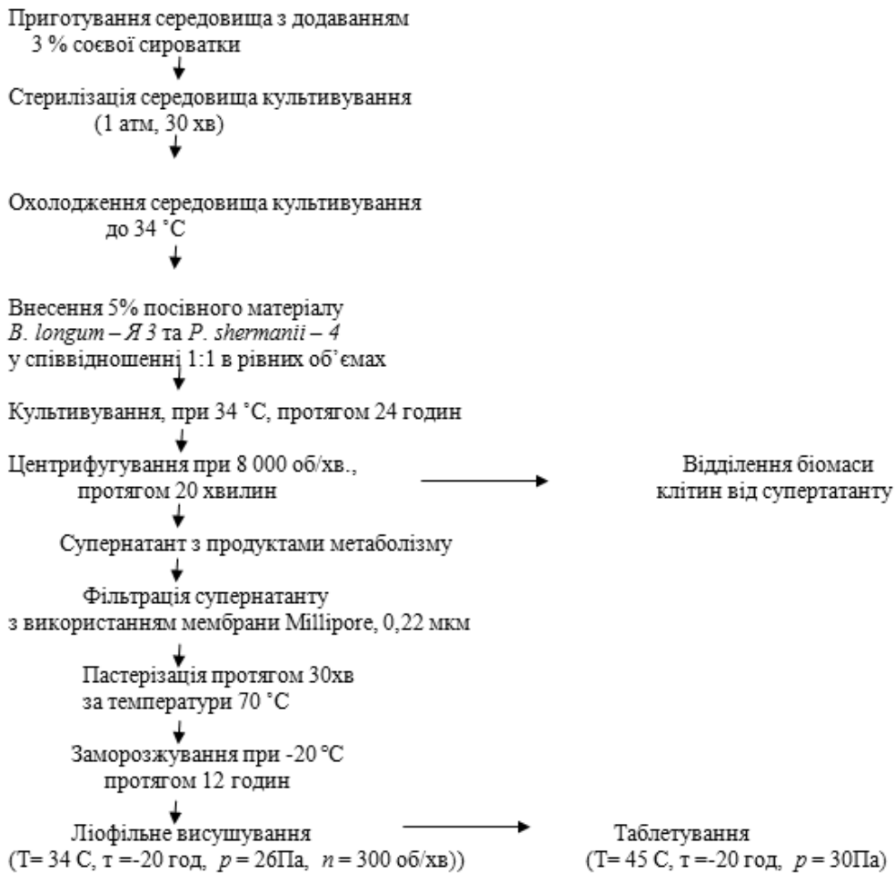
Рис. 3. Принципова технологічна схема отримання пробіотика метаболітного типу

На рис. 3 представлена принципова технологічна схема виробництва пробіотика метаболітного типу.