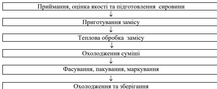
Рис. 2. Технологічна схема виробництва сиркової пасти з пюре кореня селери

В дослідному взірці № 2 сиркової пасти з пюре кореня селери визначали хімічний склад: білки, клітковину, органічні кислоти, зольні елементи (табл. 4).