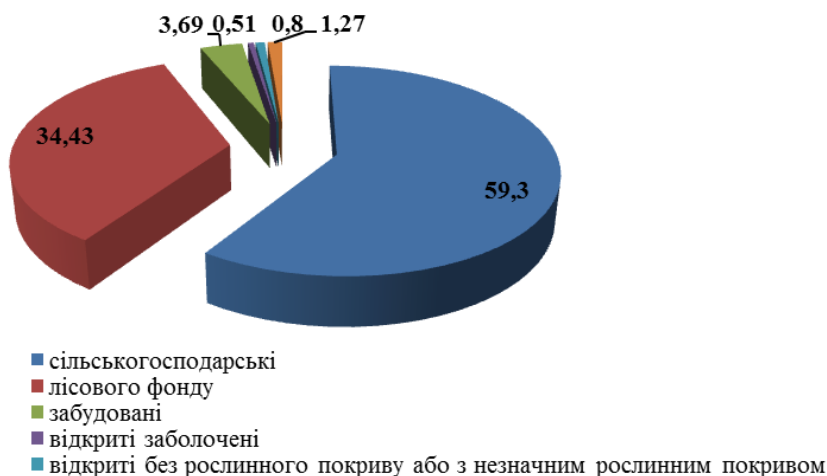
Рис. 2. Структура земельного фонду Бродівського району, %

Структура земельного фонду району представлена на рис. 2. Найбільшу площу займають сільськогосподарські землі – 59,3%, з яких рілля становить 61,5%. Основними проблемами з охорони земельних ресурсів є зменшення поживних речовин у ґрунтах, водна ерозія ґрунтів і недостатня рекультивация порушених земель.