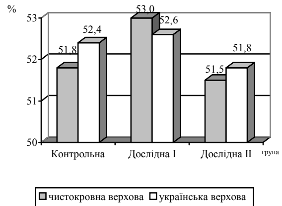
Рис. 1. Відносна кількість Т-загальних лімфоцитів у крові лоша́т, %

Вміст Т-загальних лімфоцитів у крові лоша́т під впливом ріботану та циклоферону наведений на рис. 1.