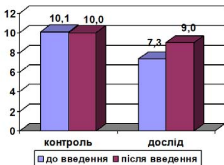
Рис. 2. Динаміка відносної кількості НК-клітин у крові цуценят

При дослідженні у крові цуценят НК-клітин (рис.2), яка також як і нейтрофіли відноситься до вродженого клітинного імунітету, звертає на себе увагу те, що у тварин контрольної групи кількісних змін популяції цих клітин практично не відбулося. Водночас у крові цуценят дослідної групи зафіксовано зростання кількості НК-клітин з 7,33 \pm 0,51 до 9,0 \pm 1,0\% . Збільшення кількості НК-клітин у крові цуценят дослідної групи ймовірно обумовлено компенсаторною реакцією організму на зниження ФА нейтрофілів. Відсутність кількісних змін НК-клітин у контрольній групі тварин свідчить про те, що ці клітини меншою мірою реагують на вакцинний антиген.