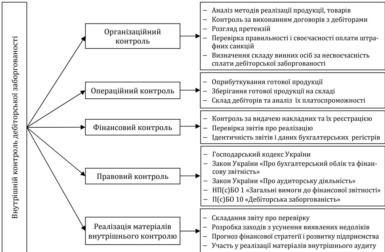
Рис. 2. Модель внутрішнього контролю дебіторської заборгованості