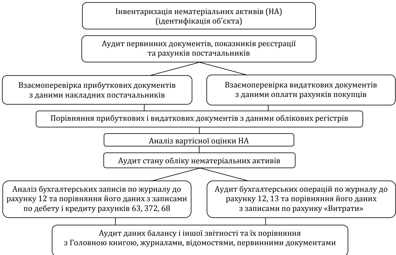
Рис. 2. Модель послідовності аудиту нематеріальних активів

Рекомендуються наступні етапи аудиту капітальних інвестицій: