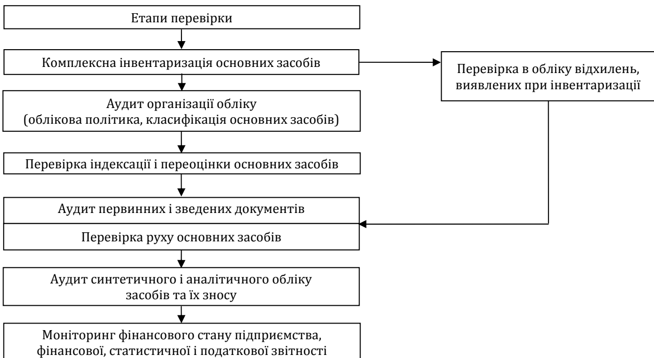
Рис. 1. Модель послідовності аудиту основних засобів

При цьому акцентується увага на наявність технічних паспортів, недіючого, некомплектного та надлишкового обладнання, що важливо в умовах нестабільних економічних відносинах. Необхідно з'ясувати обставини і причини відхилень, доцільно вказати рекомендації по їх усуненню, а також перевірити включення неоприбуткованих основних засобів в податковий дохід підприємства. На даному етапі перевірки також здійснюється оцінка