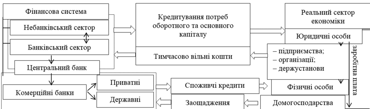
Рис. 2. Взаємозв'язок банківської системи з економічною системою країни [складено автором на основі 27]

Л. П. Дроздовська стверджує, що банківська система має всі загальносистемні властивості: цілісність (зберігає цілісність при зміні окремих її елементів, при особливій значущості системоутворюючих елементів; структурованість (включає елементи, підпорядковані спільним цілям, не є механічним об'єднанням суб'єктів, що функціонують на ринку; має встановлені зв'язки і відносини між елементами, розподіл елементів по горизонталі та рівнях ієрархії, що створює умови для формування руху ресурсів різних видів); обумовленість поведінки (визначається не стільки поведінкою окремих елементів, скільки властивостями структури банківської системи); взаємозв'язки з середовищем (здатність реагувати на зміни в зовнішньому середовищі, насамперед, економіки країни);