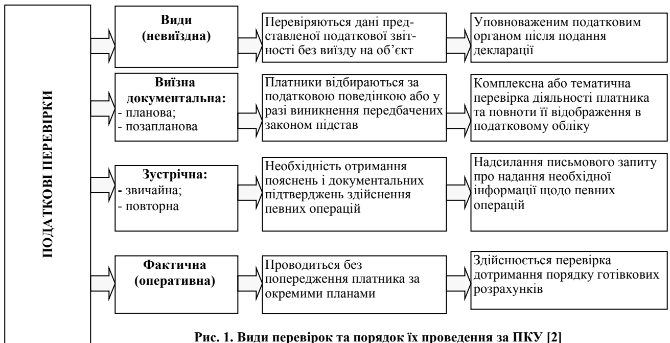
Рис. 1. Види перевірок та порядок їх проведення за ПКУ [2]

При цьому, платники податків з незначним ступенем ризику будуть включатися до плану-графіка не частіше, ніж раз на три календарних роки, середнім – не частіше, ніж раз на два календарних роки, високим – не частіше одного разу на календарний рік [1].