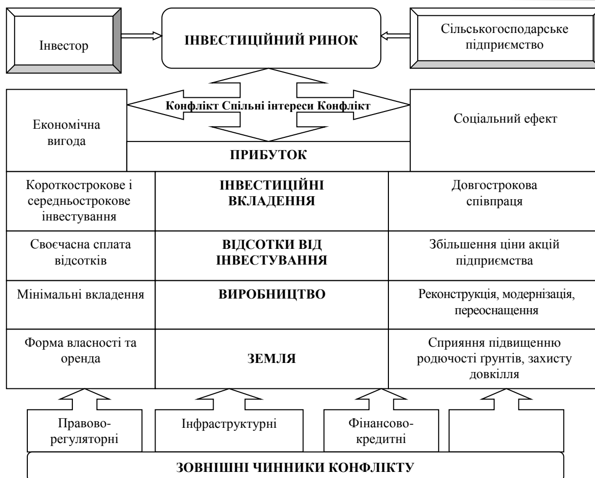
Рис. 2. Схема конфлікту інтересів «інвестор-сільськогосподарське підприємство»