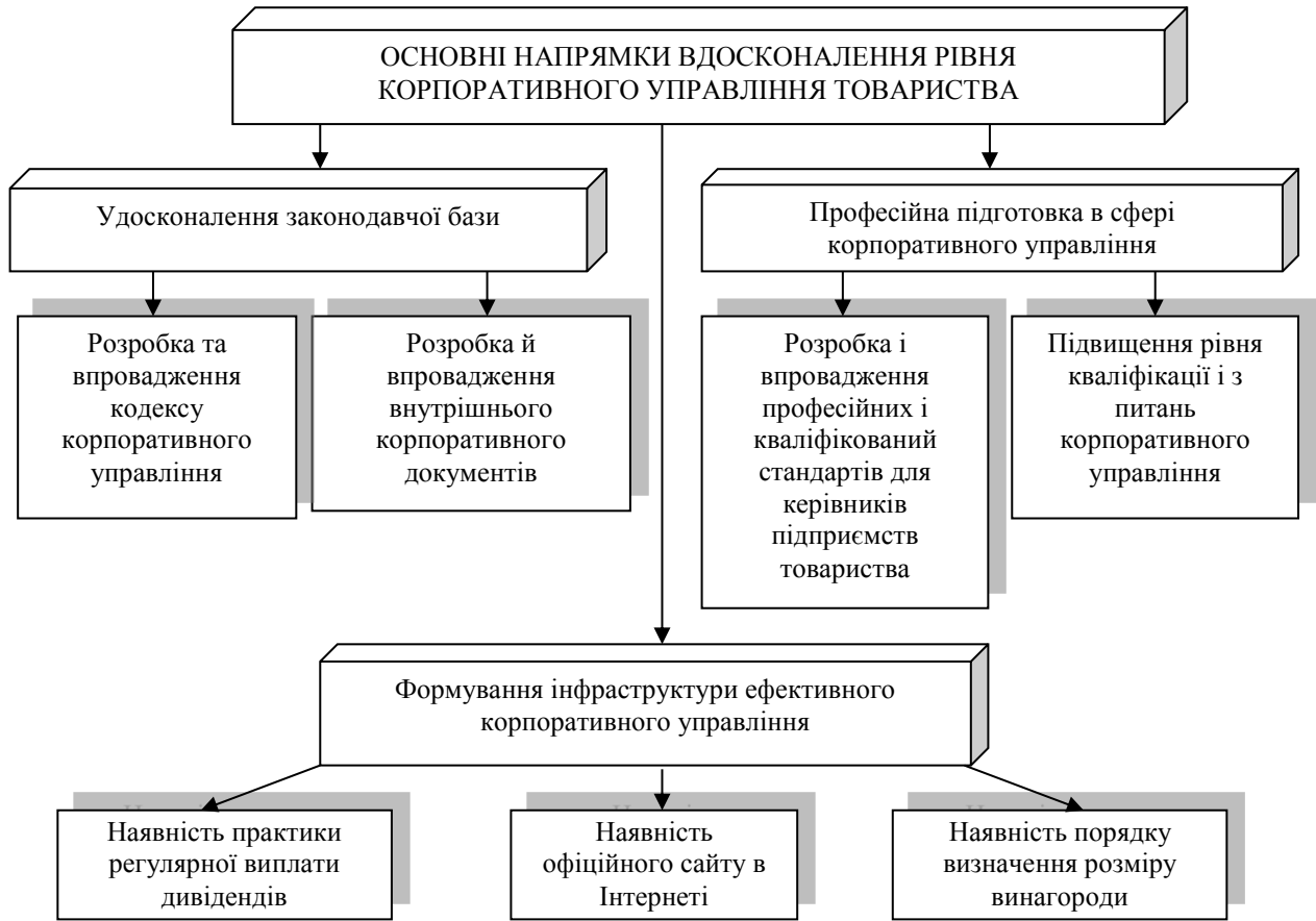
Рис. 4. Напрямки вдосконалення рівня корпоративного управління на ПАТ «Коломийська друкарня ім. Шухевича»

суспільним благом, яке ділитимуть усі за кількістю акцій і тоді буде можливість задіяти механізми удосконалення рівня корпоративного управління (рис. 5).