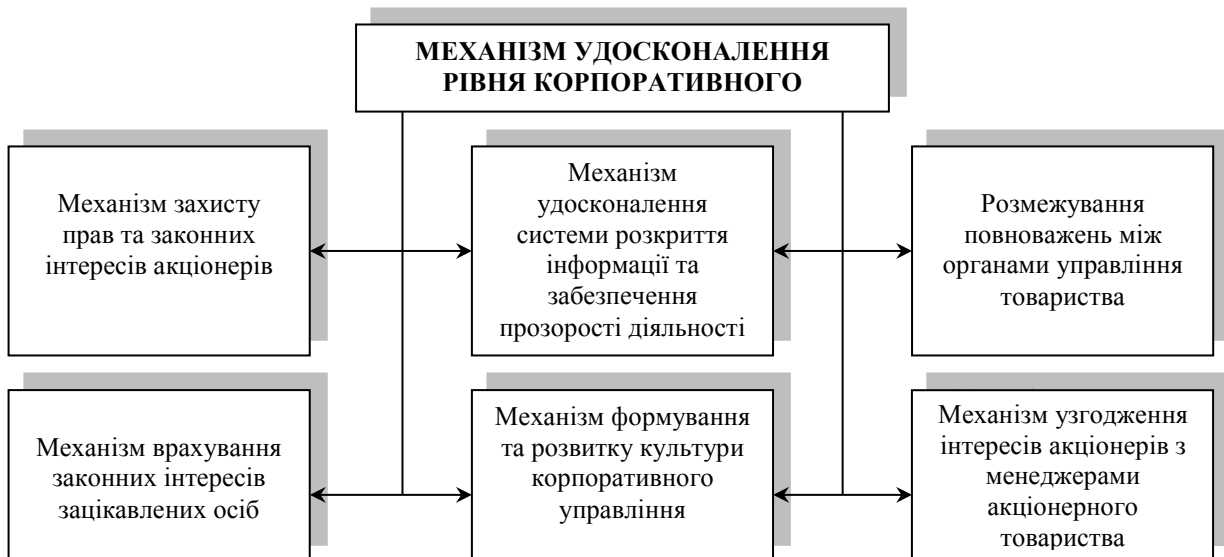
Рис. 5. Внутрішній механізм корпоративного управління в акціонерному товаристві

З цієї причини розпорошеність власності справляє дестимулюючий (щодо контролю) вплив на акціонерів. Звісно, пасивність власників розв'язує руки неконтрольованим менеджерам. В Україні це набуло