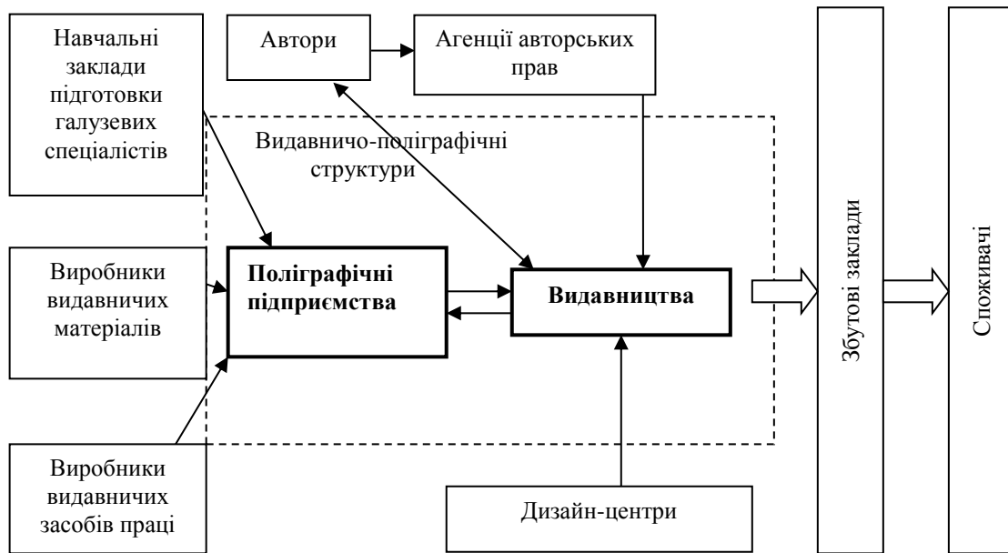
Рис. 1. Основні учасники видавничого ринку

Разом з тим обсяги виробництва невидавничої продукції мають чітку динаміку підвищення, що зумовлено зростаючим попитом на неї і це приводить до поступового перетворення видавничих організацій з провідної ланки на другорядну, адже поліграфічні підприємства випереджають їх за обсягами отриманого чистого доходу від реалізації продукції, а в більшості випадків – і за прибутковістю. Це загалом негативна тенденція, яку можна пояснити такими чинниками: суспільство поступово втрачає бажання і здатність отримувати основну масу інформації через друковане слово; комерціалізацією всіх сфер життя і стимулюванням попиту на товари шляхом використання виробниками якісного пакування та етикеток; потребою у періодичному оновленні дизайну пакування, етикеток і супровідної документації.