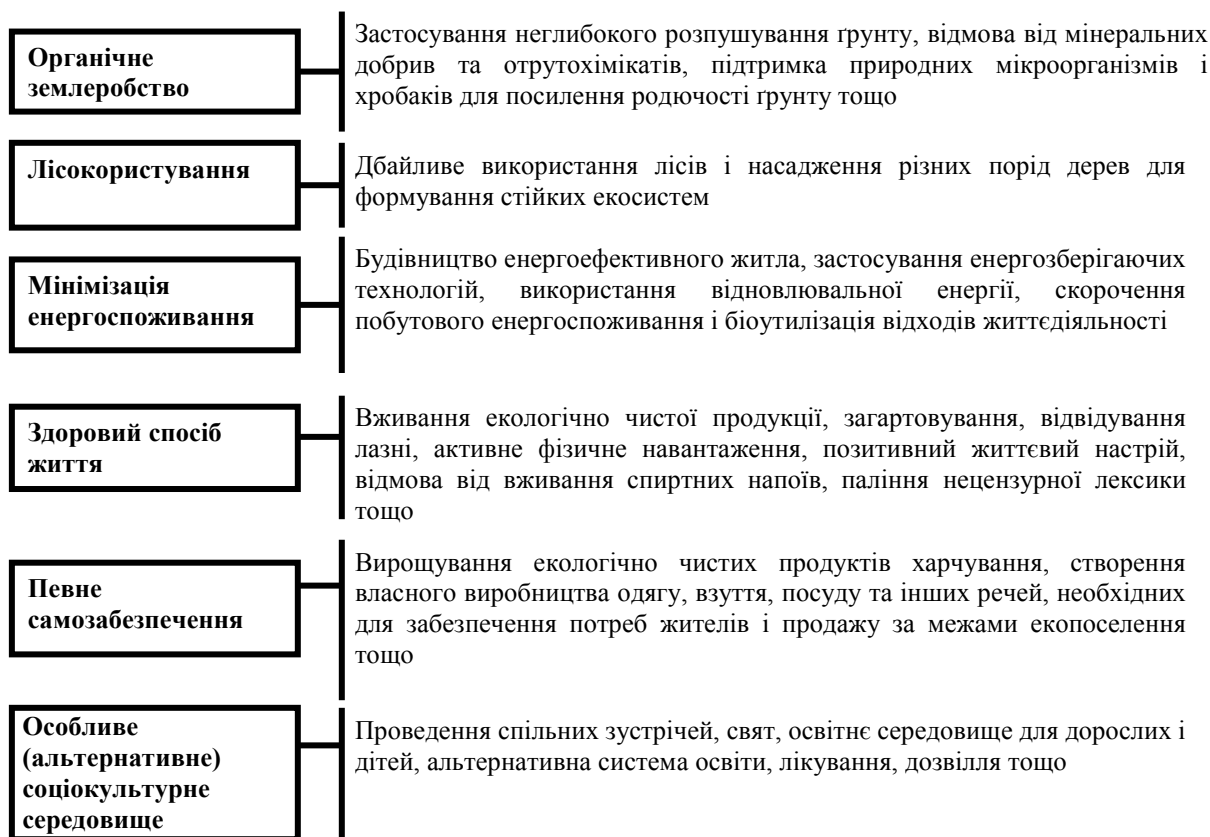
Рис. 2. Визначальні ознаки екопоселень в Україні

об'єднуючись утворюють общини з різними формами організації функціонування екопоселень.