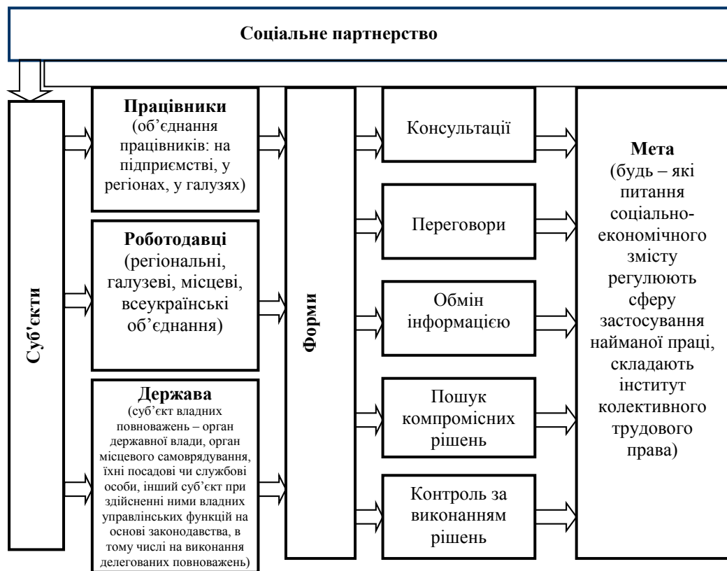
Рис. 1. Соціальне партнерство як механізм реалізації регулювання трудового права

виробництва на підставі об'єднання активів держави з приватного сектору. інвестиційними, управлінськими та іншими ресурсами