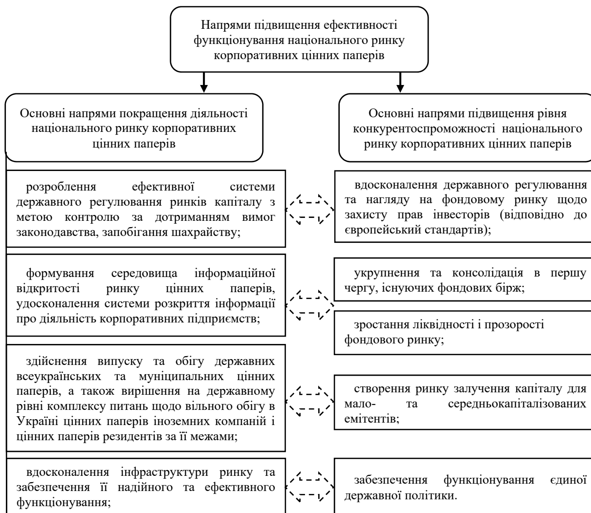
Рис. 2. Основні напрями підвищення конкурентоспроможності та ефективності функціонування національного ринку корпоративних цінних паперів

Рівень ефективності функціонування національного ринку корпоративних цінних паперів напряму залежить від належного інфраструктурного забезпечення, яке сьогодні в Україні відсутнє. Тому необхідно запровадити електронний документообіг при укладанні та виконанні угод з цінними паперами; прийняти єдині стандарти та сертифікувати системи електронного цифрового підпису та шифрування даних (відповідно до європейських стандартів).