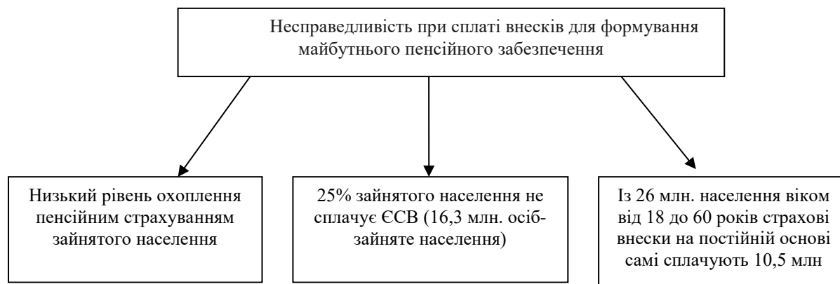
Рис. 1. Причини неефективності пенсійної реформи

По суті, пенсійна система в нашій країні з пенсійною реформою не зміниться – вона і надалі буде залишатися солідарною. Правда, тепер її модернізують, з'явиться можливість перейти до накопичувальної системи: спочатку за рахунок державних накопичувальних фондів, а згодом і приватних структур.