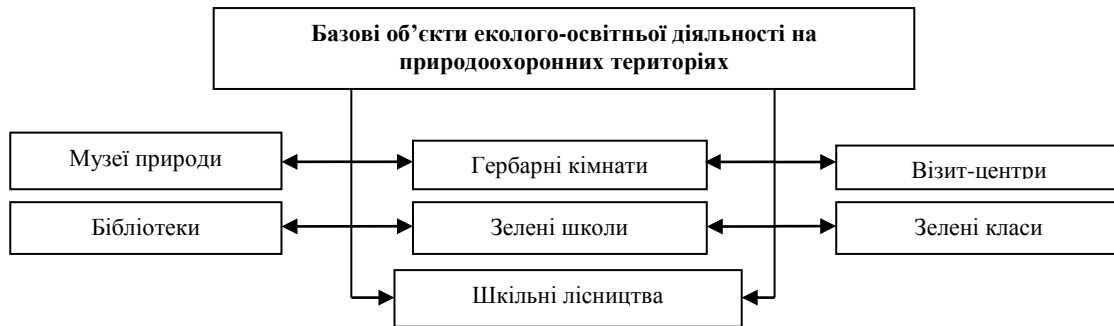
Рис. 1 Об'єкти еколого-освітньої діяльності на природоохоронних територіях*