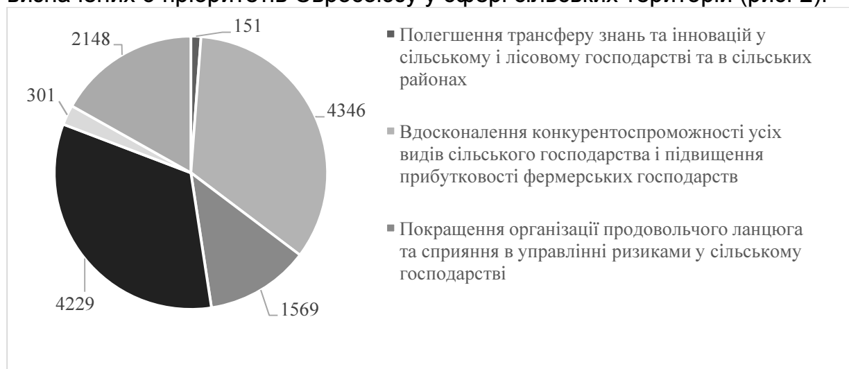
Рис. 2. Перелік і заплановані обсяги фінансування Програми розвитку сільських територій Польщі на 2014–2020 роки, млн євро*

Реалізації даних цілей планується досягти за допомогою визначених 6 пріоритетів Євросоюзу у сфері сільських територій (рис. 2).