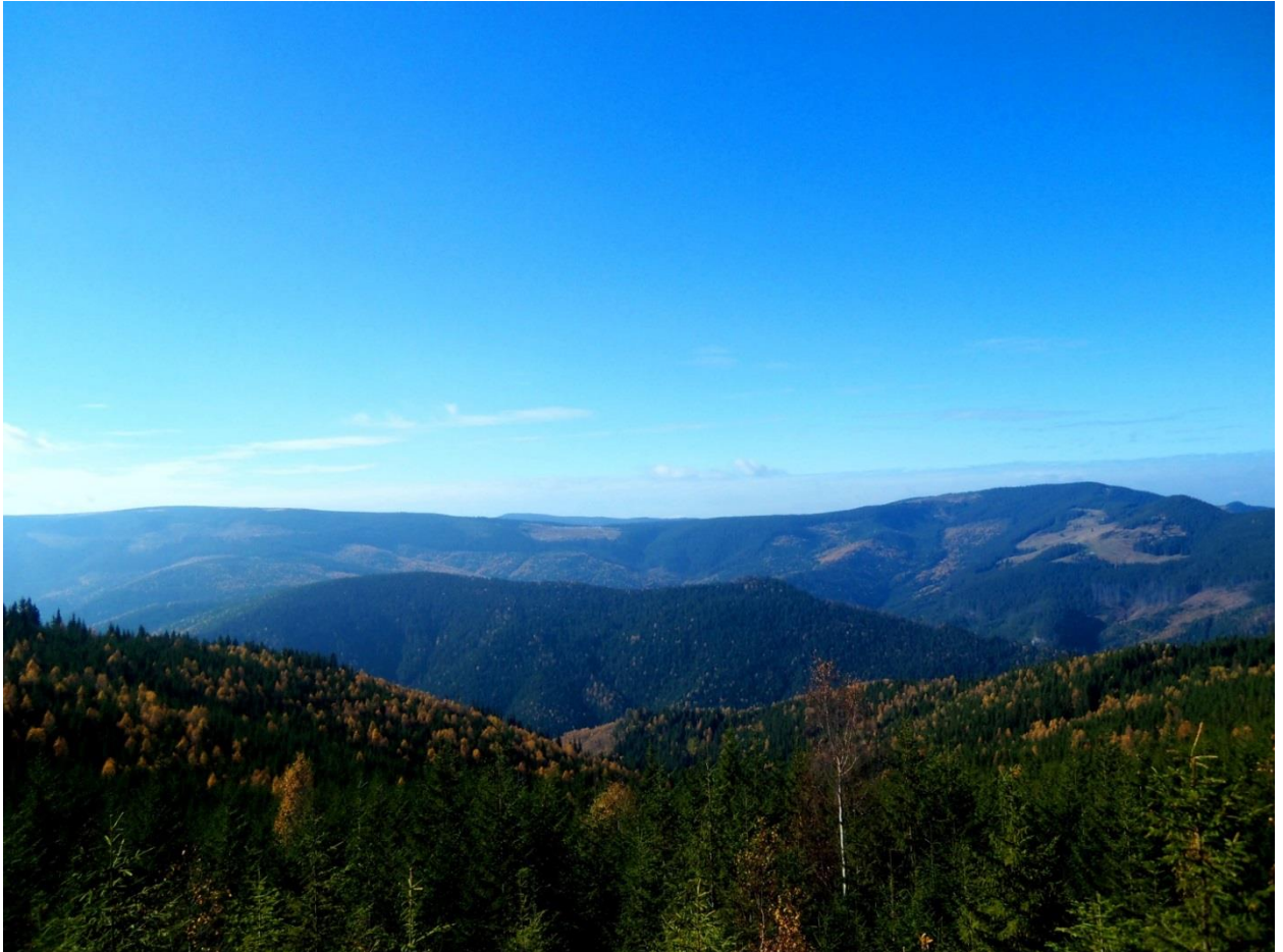
Фото . Панорама Буковинських Карпат

Загалом, формування території НПП “Черемоський” розпочалось у 1972 р., коли були взяті під охорону скелі на г. Великий Камінь і створено геологічну пам’ятку природи місцевого значення “Чорний діл” площею 2,0 га. Пізніше, у 1979 р., рішенням Чернівецького облвиконкому її територію збільшено до 263.0 га, а у 1980 р. Постановою Ради Міністрів Української РСР оголошено ландшафтним заказником загальнодержавного значення.