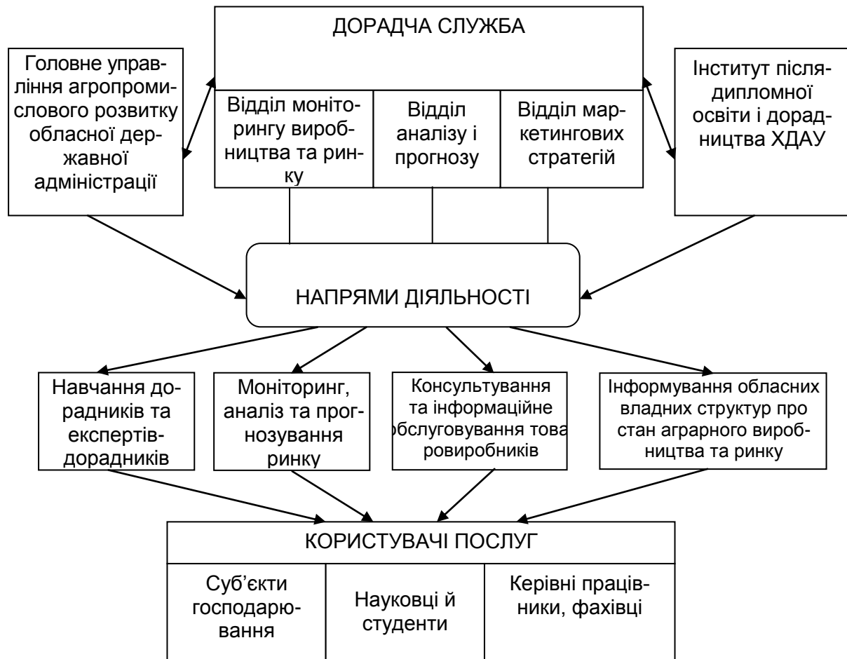
Рис. 3. Схема функціонування Херсонської обласної дорадчої служби

розбудови ефективного сільського господарства, безпосередньо на рівні села, не було б такої активності в створенні кооперативів, спілок виробників та здавачів молока, а головне, – не було б стимулу до об'єднання громадян і дрібних товаровиробників.