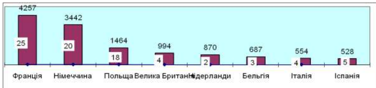
Рис. 2. Кількість працюючих заводів та обсяг виробництва цукру (тис. т) країнами – найбільшими виробниками в ЄС (дані 2010/11 МР)

МР, працювало 25 цукрових заводів), Німеччина (3442 тис. т, 20 підприємств), Польща (1464 тис. т, 18 заводів), Велика Британія (994 тис. т, 4 підприємства), Нідерланди (двома компаніями вироблено 870 тис. т) (рис. 2). У 2011/12 МР обсяг виробництва цукру в ЄС, за попередніми даними, є більшим порівняно з попереднім роком (17–18 млн т), зокрема, в Німеччині випуск цукру перевищує 4 млн т.