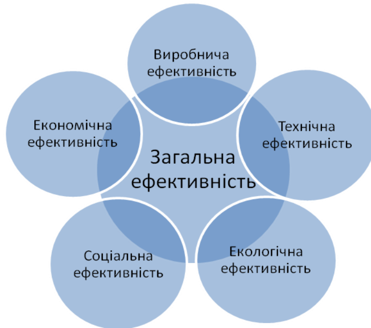
Рис. 1. Основні складові формування загальної ефективності в аграрних формуваннях*

Всі види ефективності тісно пов'язані між собою, взаємозалежні і разом визначають ефективність економічної системи загалом (рис.1).