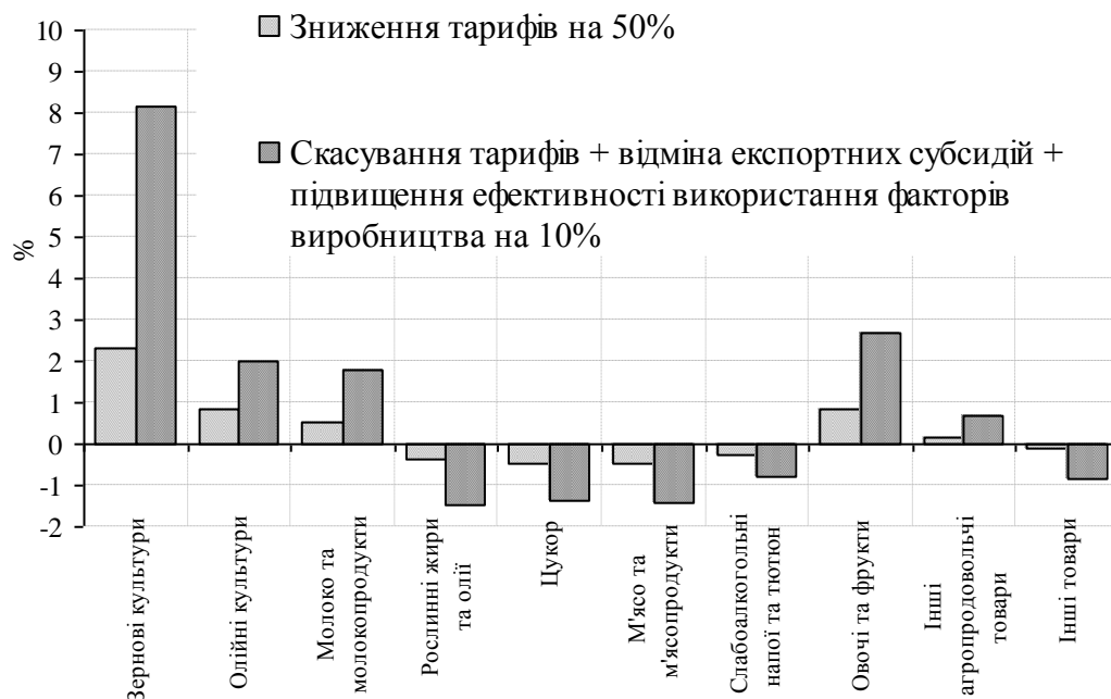
Рис. 2. Вплив скасування торгівельних тарифів у рамках ЗВТ Україна - ЄС на зміну ринкової ціни в Україні на основні групи агропродовольчих товарів, %*

когосподарської землі є однією з найнижчих в Європі, проте оцінюється в 7000–8000 дол. США за 1 га.