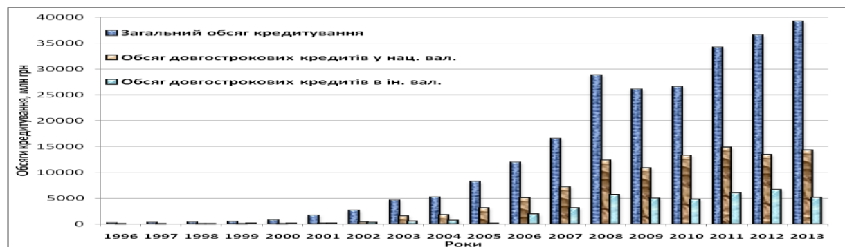
Рис.1. Обсяги кредитування аграрних підприємств (млн. грн.)*