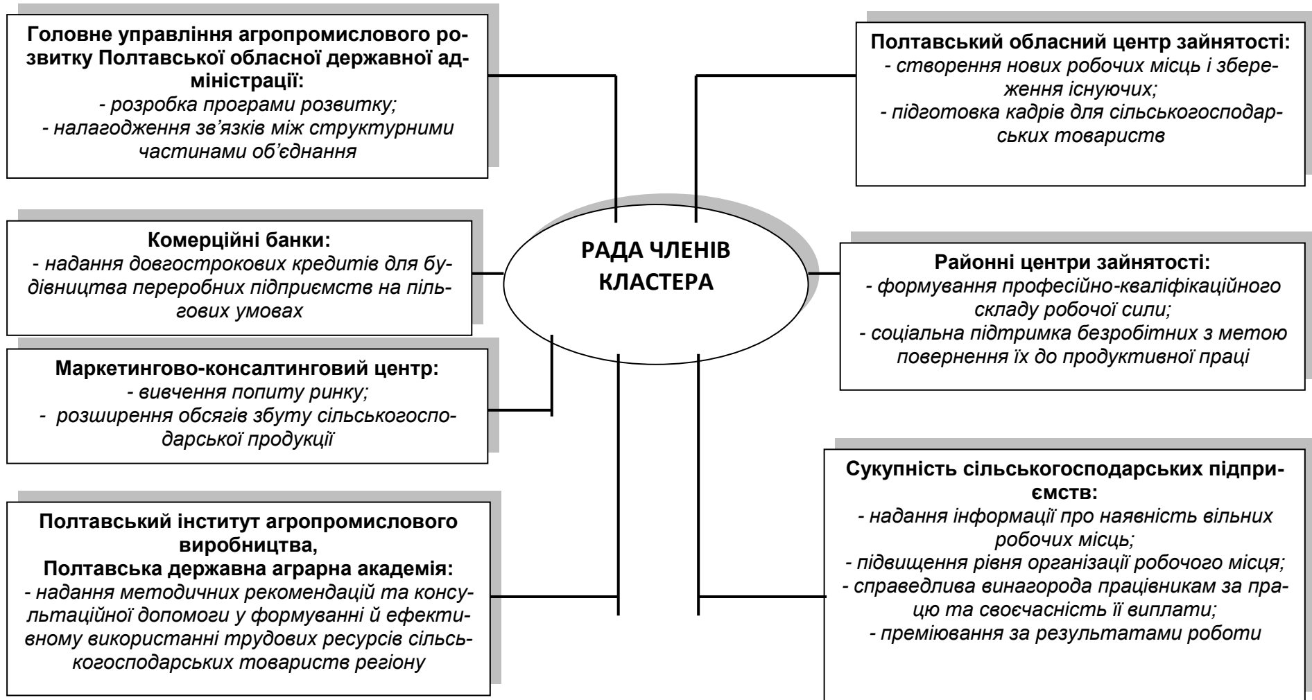
Рис. 2. Регіональний кластер сільськогосподарських підприємств