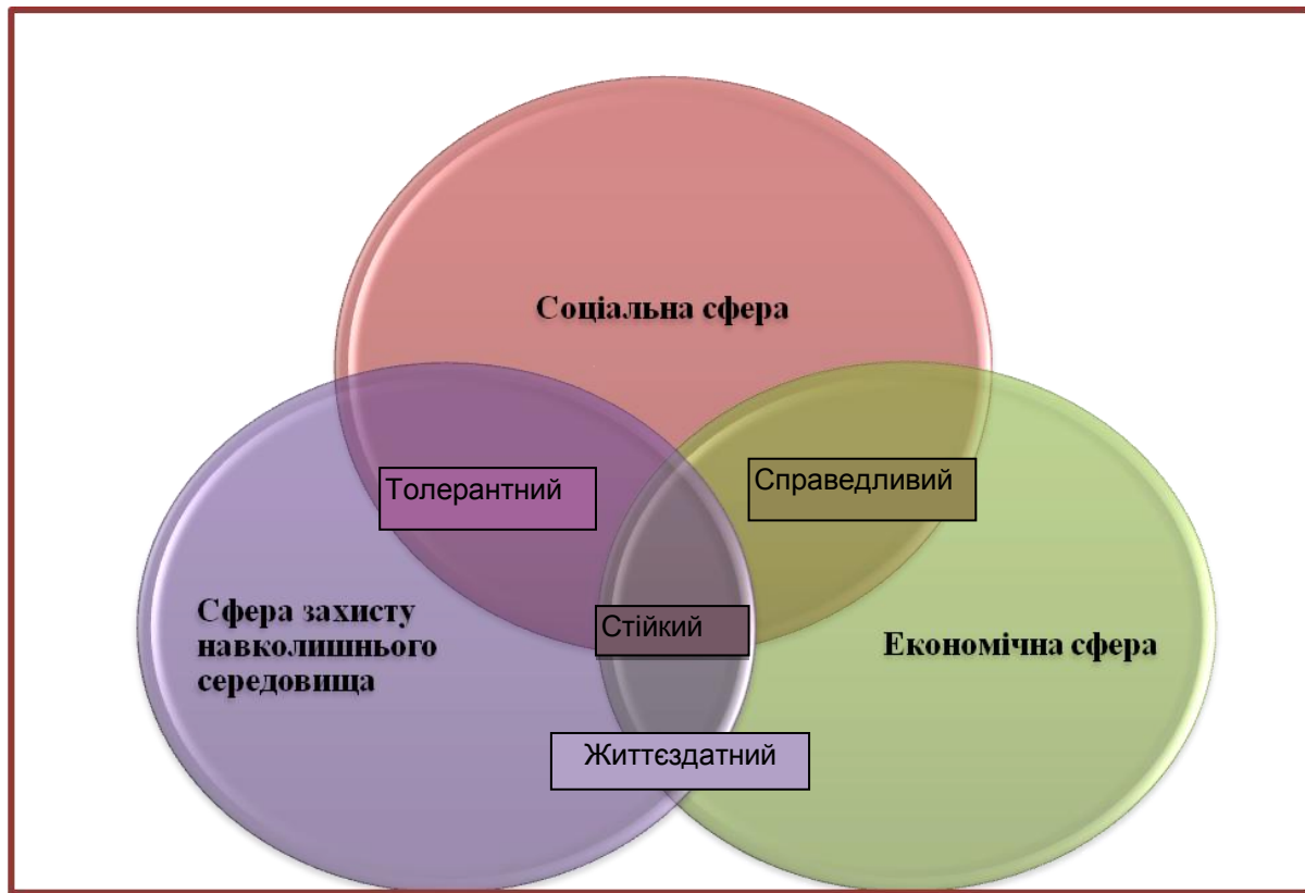
Рис. 1. Модель сталого розвитку [4]

високий рівень освіти населення може зміцнити трудовий капітал країн і тим самим позитивно вплинути для економічного зростання ЄС.