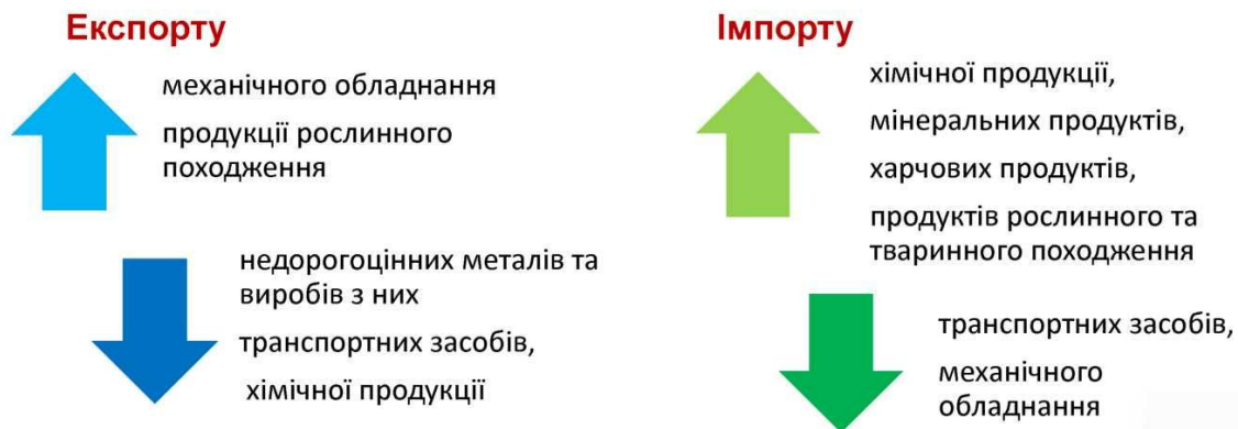
Рис.1. Зміни у товарній структурі експорту та імпорту (2011 – 2012 рр.).

засобів захисту рослин, дизельного пального, спонукало зростання цін на ці види товарів, що обмежило можливості розвитку підприємств аграрного сектора [1, 4].