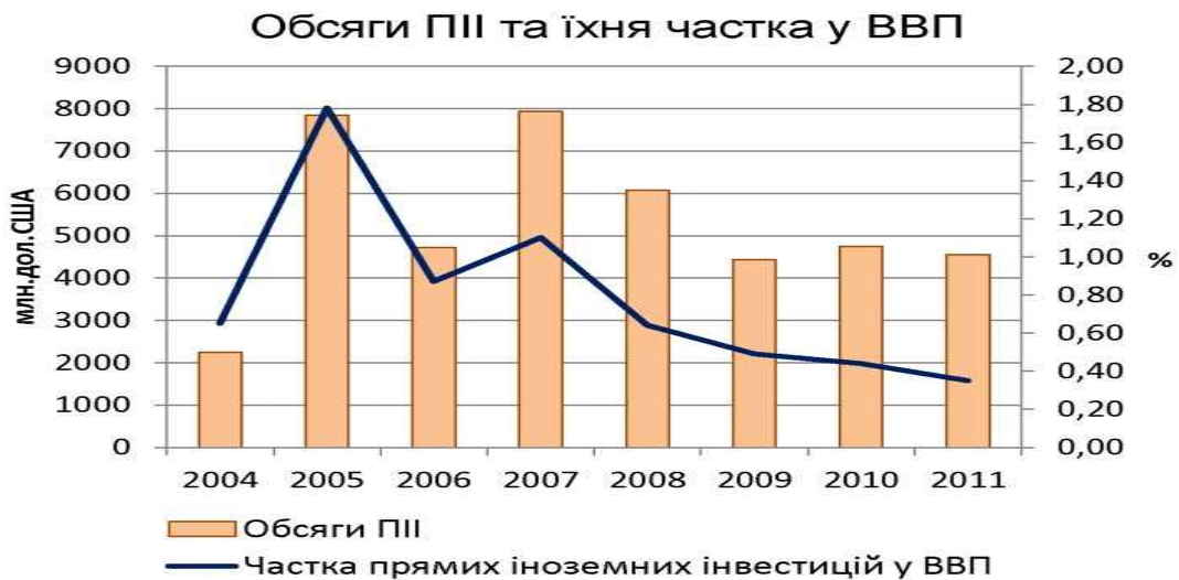
Рис. 4. Динаміка іноземних інвестицій (2004-2011 рр.).

Результативність подальших структурних перетворень економіки та модернізація промисловості значною мірою обумовлюється можливістю забезпечення їх інвестиційними ресурсами. Дослідженнями доведено, що падіння обсягів прямих іноземних інвестицій відбулося ще в докризовий період (рис.4).