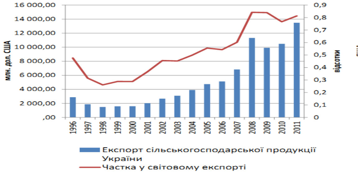
Рис. 3. Обсяги експорту сільськогосподарської продукції та їх частка у світовому експорті.

За даними: International Trade and Market Access Data, WTO.