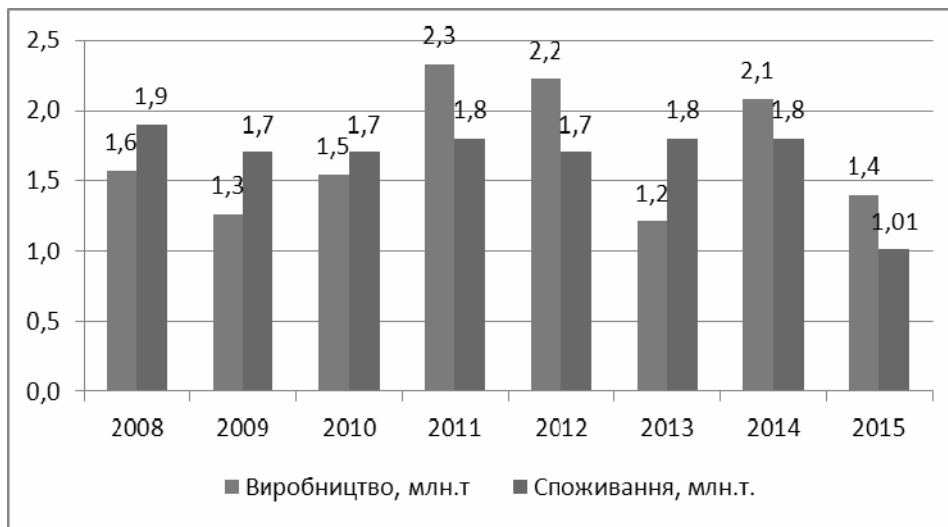
Рис. 2. Динаміка виробництва та споживання цукру в Україні за 2008–2015 роки*

Проведений нами аналіз функціонування галузі свідчить, що скорочення кількості цукрових заводів в Україні відбулося за рахунок перевищення обсягу виробництва над обсягом споживання (рис. 2).