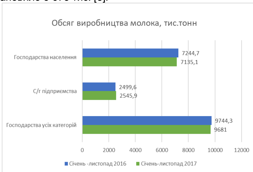
Рис.1. Обсяги виробництва молока в Україні, тис. тонн*

Останніми роками частка домогосподарств населення зменшилася. Очікується подальше збільшення частки с.-г підприємств у виробництві молока. За даними Державної служби статистики України, поголів'я корів в Україні, станом на 1 січня 2017 р., становило 2 172,3 тис. Зміни у розподілі виробництва молока призвели до зростання середньої продуктивності корів. У 2015 р. середній надій зріс до 4 644 кг/голову. Станом на початок 2017 р. поголів'я корів становило 3 675 тис. [6].