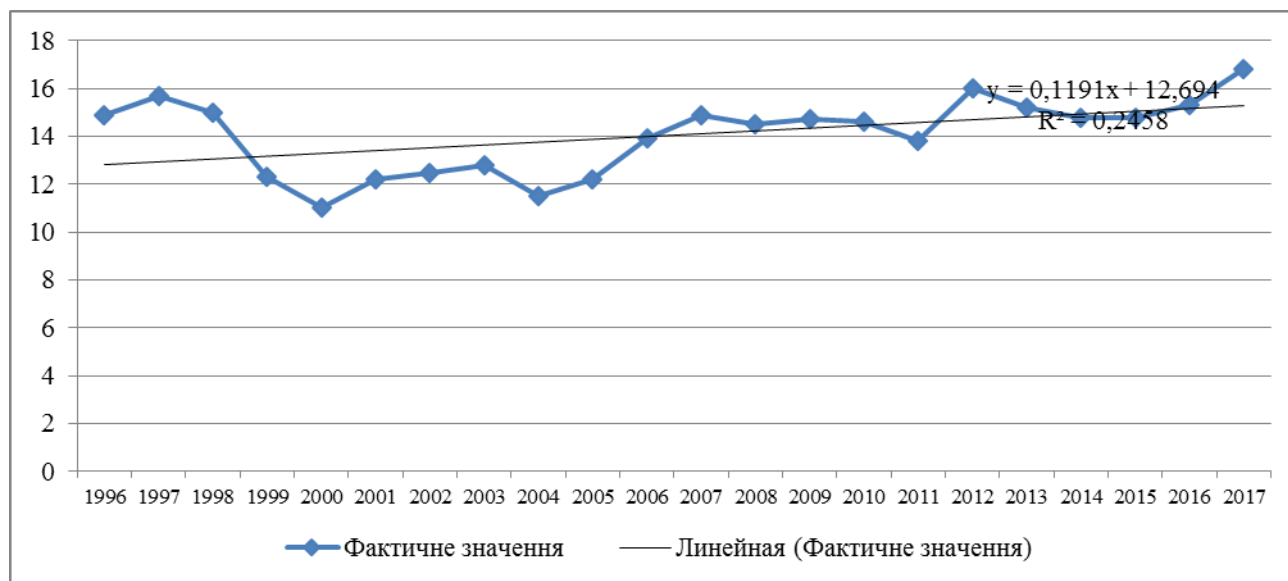
Рис. 3. Частка доходів місцевих бюджетів у ВВП України, 1996-2017 роки, %*

Значні коливання частки доходів місцевих бюджетів у ВВП не дають змоги зробити висновок про її чітку тенденцію (зменшення чи збільшення). Виявити тенденцію можна за допомогою побудови лінії тренду (рис. 3).