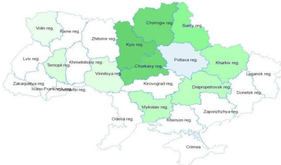
Рис. 2. Виробництво молока ґатунку екстра в Україні за областями, 2016 рік

готової продукції споживачам, сільське господарство знаходиться у складному становищі, перш за все, через велику роздробленість виробництва. Це не тільки ускладнює збір сировини, а й призводить до зменшення якості сирого молока.