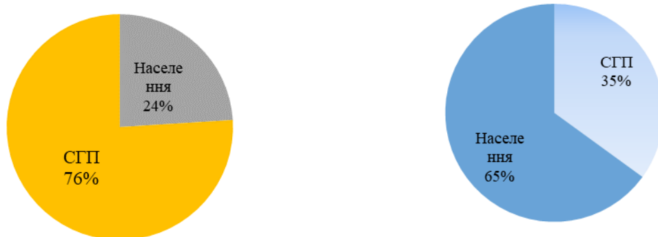
Рис. 2. Виробництво молока всього по Україні, 1992 та 2016 роки

закупівельною ціною. Якщо закупівельна ціна на молоко 1 ґатунку станом на весну 2017 року коливалась від 5500 до 9200 грн./т, та в середньому по Україні складала 7600 грн., то закупівельні ціни у населення – відповідно від 3100 до 6000 та 4700 в середньому по Україні [2, ст. 11].