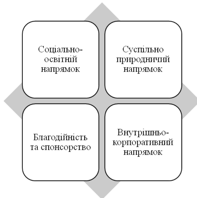
Рис. 2. Основні напрями корпоративної соціальної відповідальності ТОВ «Сингента»

націлені на реалізацію важливих внутрішніх та зовнішніх соціальних програм, результати яких сприяють розвитку компанії, покращенню її репутації та іміджу, а також розширенню партнерських зв'язків з державою, громадськими організаціями, місцевими громадами та навчальними закладами. Корпоративну соціальну відповідальність у компанії Сингента можна поділити на чотири основні напрями (рис.2), які вона постійно розвиває.