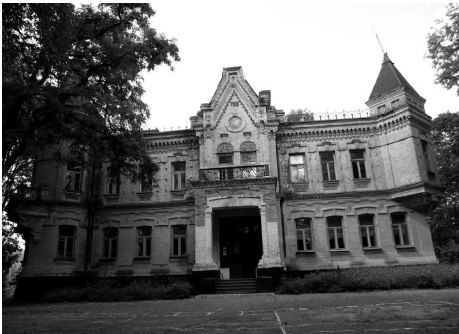
Рис. 2. Палац Наталії Уварової