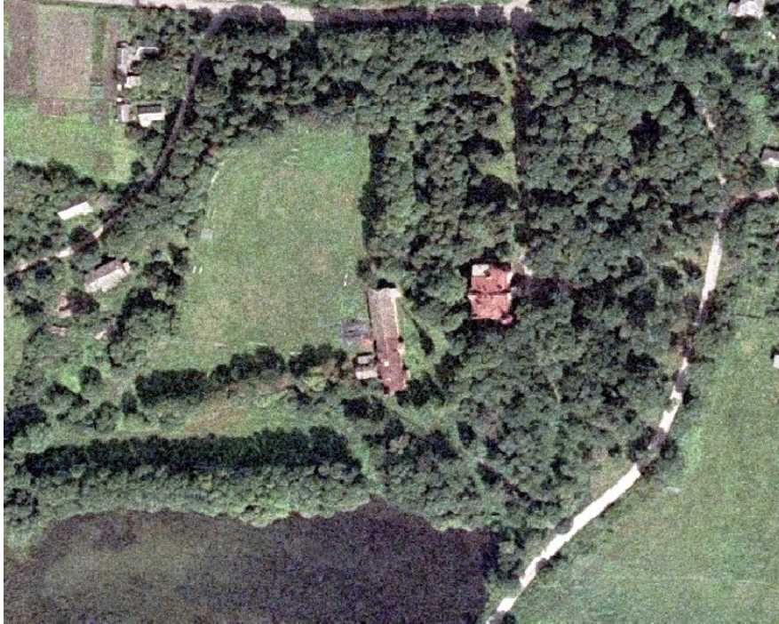
Рис. 1. Супутниковий знімок Турчинівського парку

Під час проведення досліджень використовували також матеріали супутникової зйомки парку, проведеної із застосуванням комп'ютерної програми ГІС-6 (рис. 1).